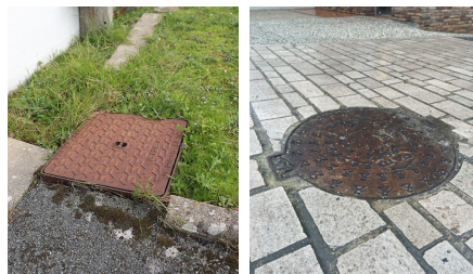
Tabourets d'assainissement collectif

Ces pratiques impactent directement le fonctionnement du service et notre maîtrise de la qualité des rejets d'eaux en milieu naturel. En respectant le règlement d'assainissement collectif, vous préservez l'environnement et la santé publique.